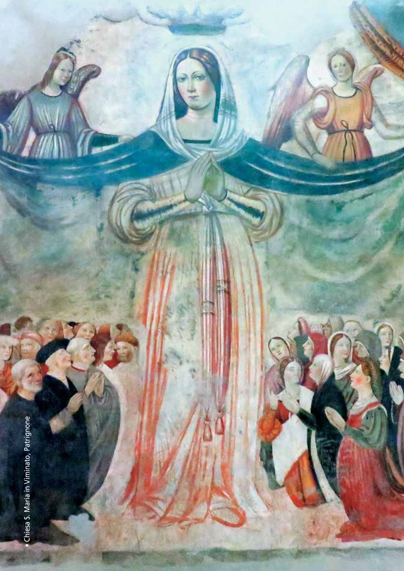
• Chiesa S. Maria in Viminato, Patignone