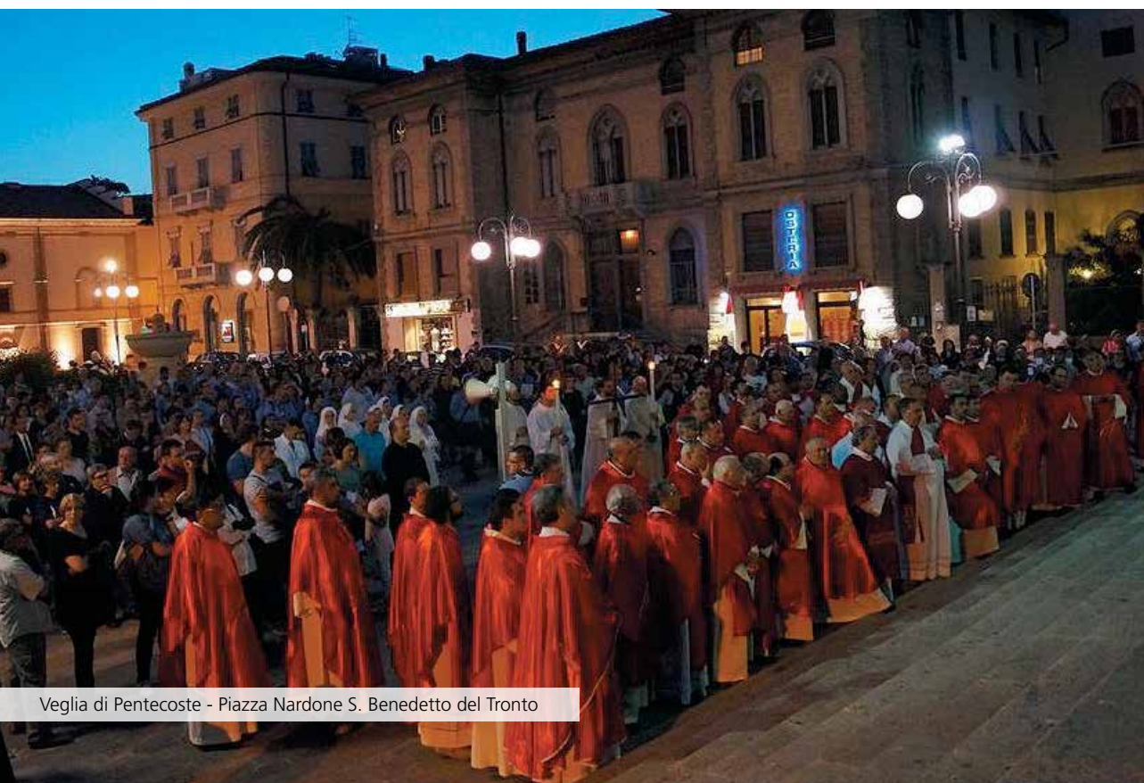
Veglia di Pentecoste - Piazza Nardone S. Benedetto del Tronto