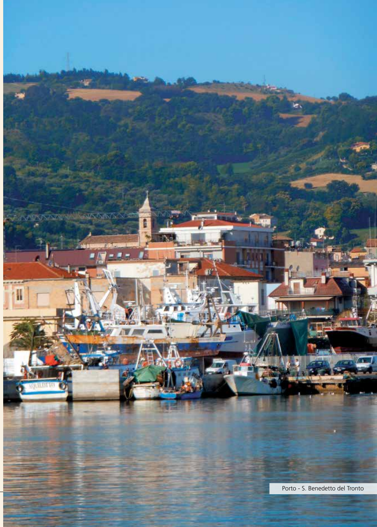
Porto - S. Benedetto del Tronto