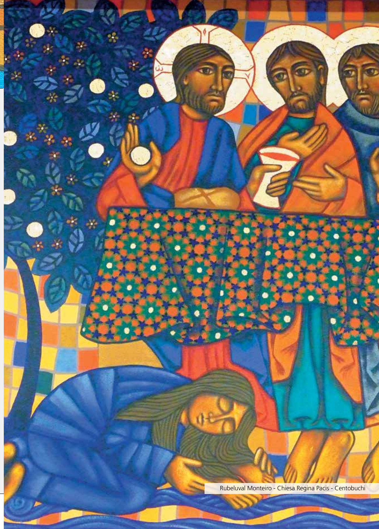
Rubelual Monteiro - Chiesa Regina Pacis - Centobuchi