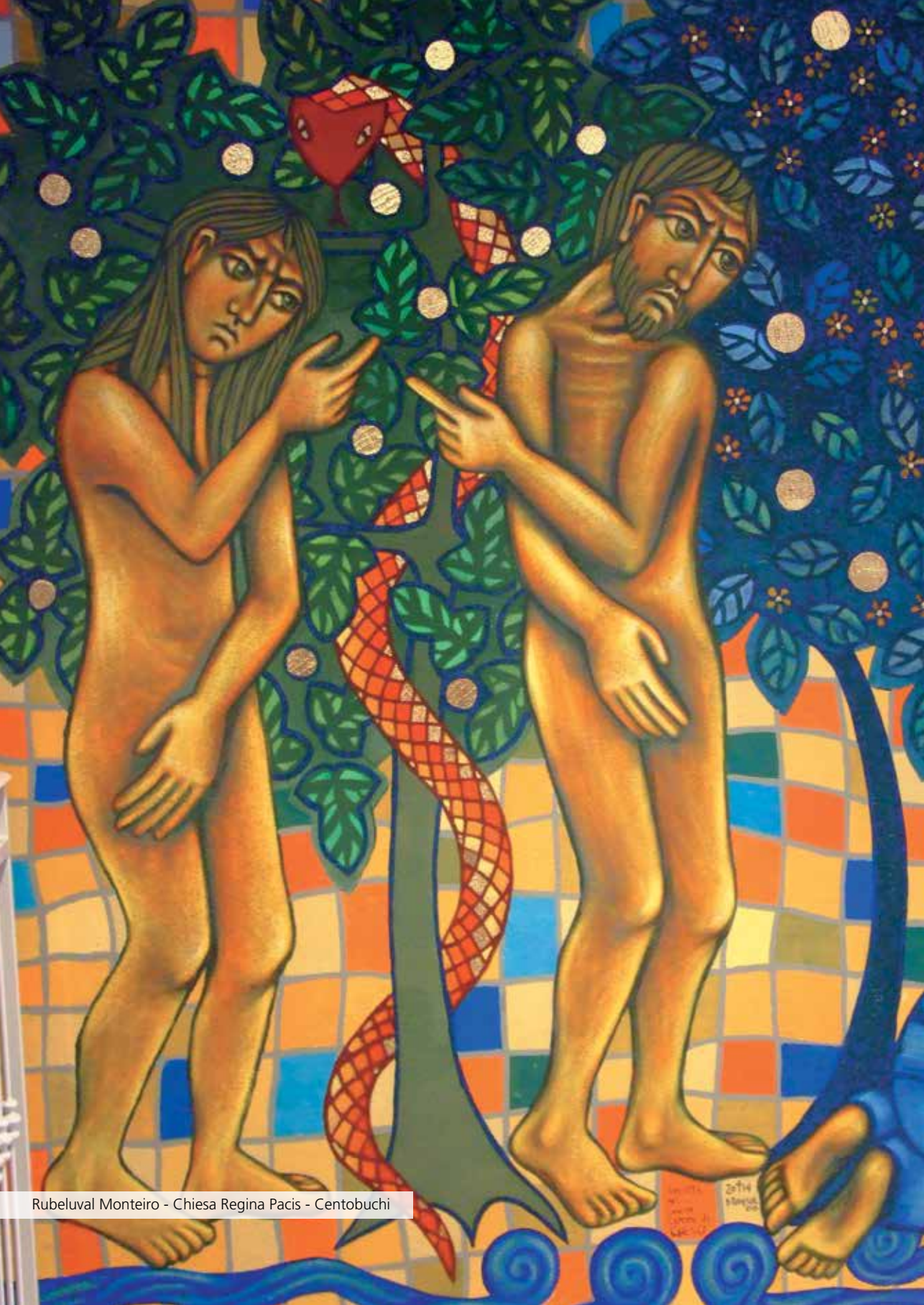
Rubelual Monteiro - Chiesa Regina Pacis - Centobuchi