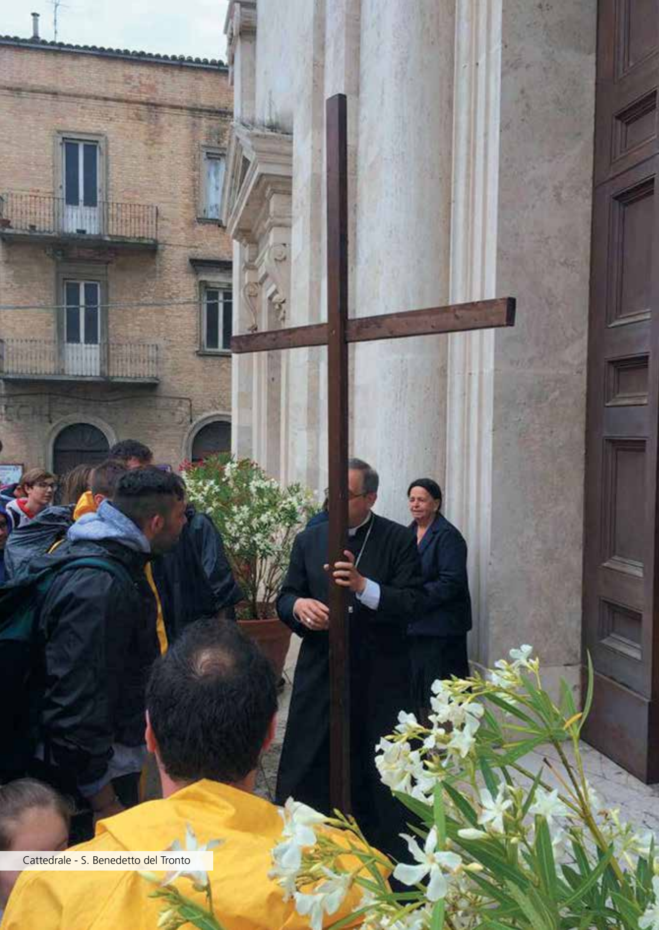
Cattedrale - S. Benedetto del Tronto