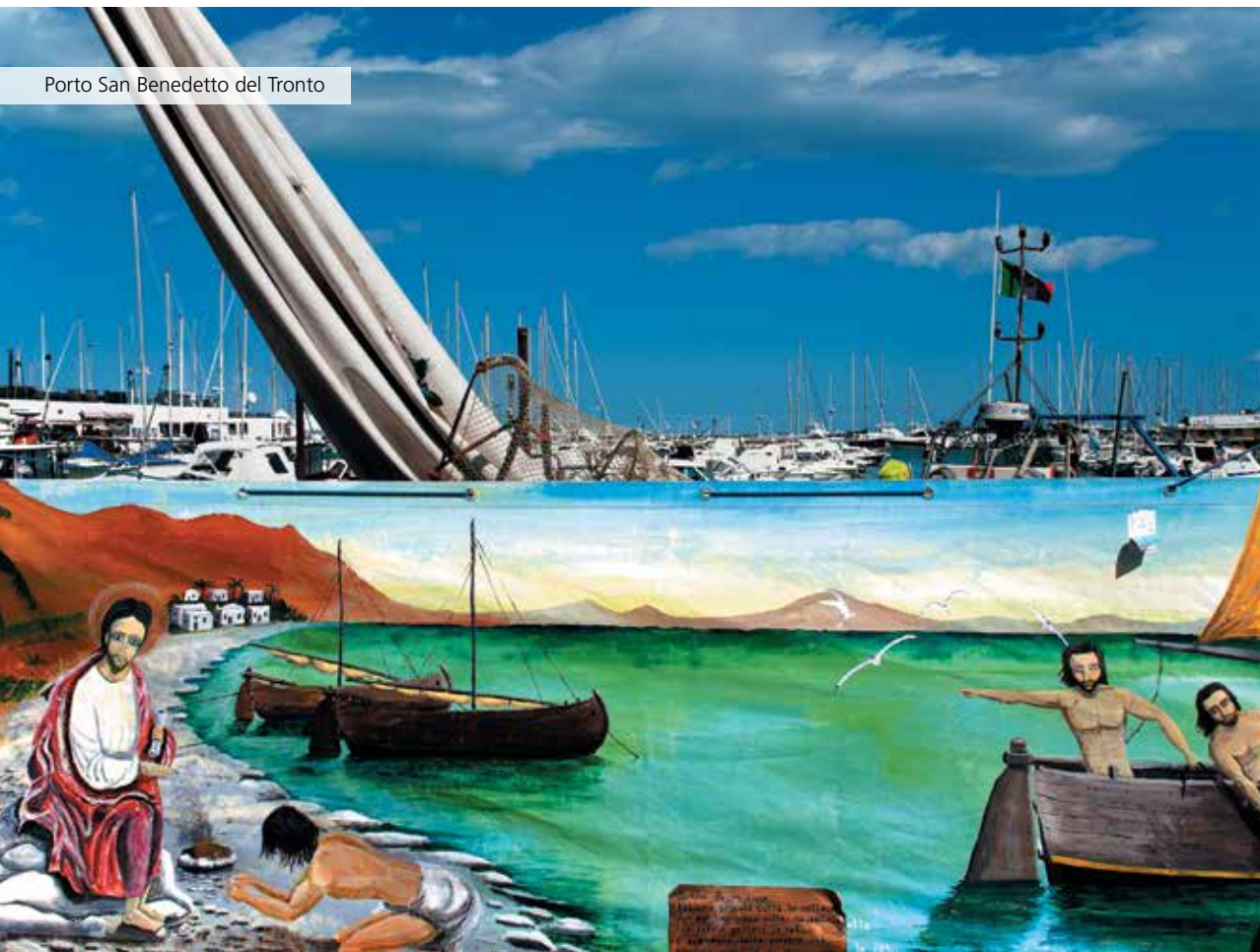
Porto San Benedetto del Tronto

Alcune domande alle quali bisognerà che insieme cerchiamo di dare una risposta, se ci vogliamo mettere in cammino sulle strade che il papa autorevolmente ci va indicando, affinché possiamo vivere con gioia il nostro essere Chiesa e comunicare la gioia del Vangelo al mondo di oggi.