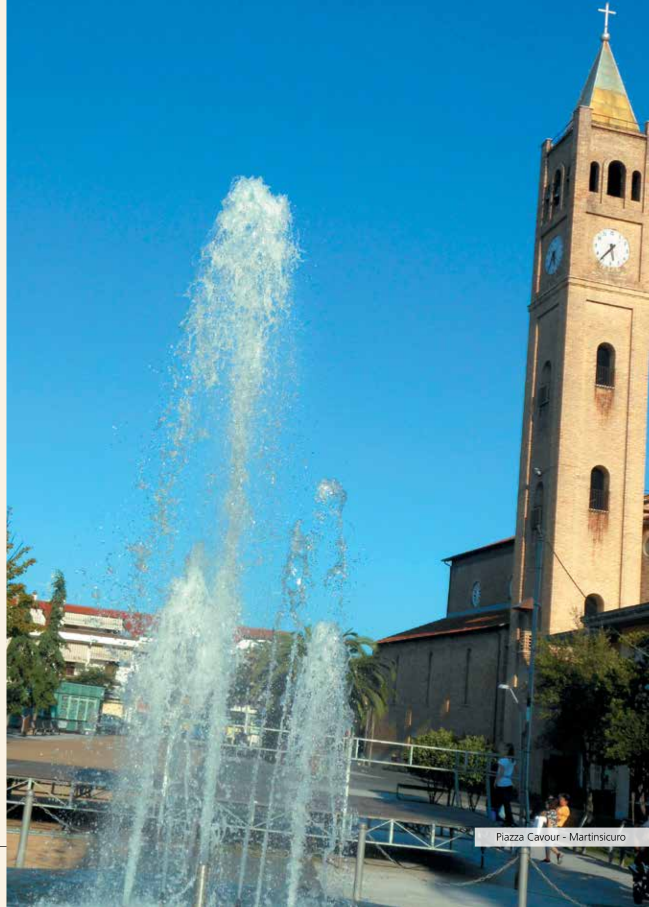
Piazza Cavour - Martinsicuro