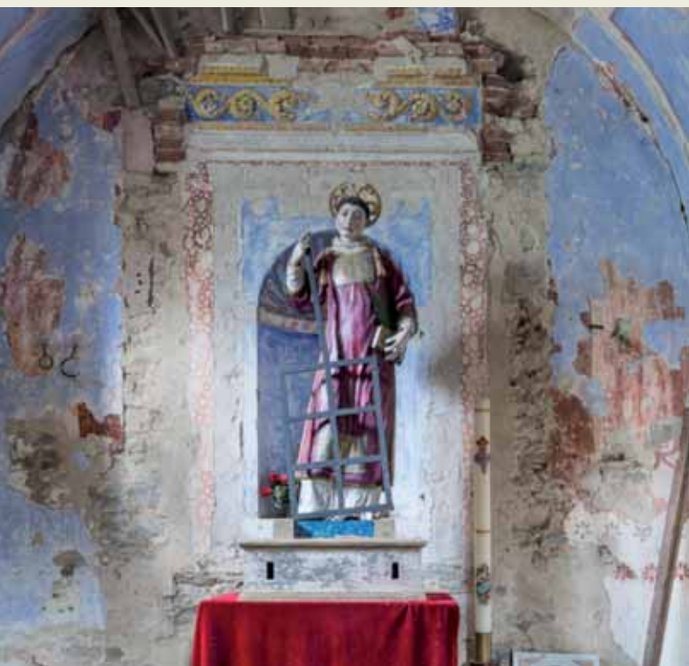
▲ Statua processionale di San Lorenzo

CONFESSIONI ogni giorno 8.00-8.30 9.00-11.00 • 16.30 17.00 18.30 domenica mezz'ora prima di ogni messa ADORA- ZIONE EUCARISTICA ogni giorno 9.00-12.00 • 16.00-18.30